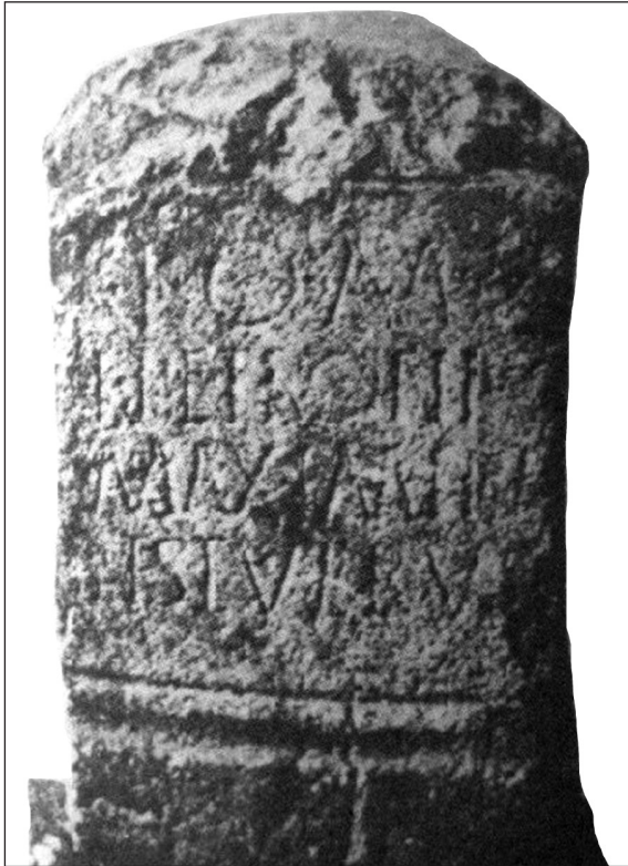
Sl. 5. Zavjetna ara posvećena Jupiteru sa kraja III ili početka IV stoljeća. Pronađena u Ceričima kod Konjica, imena dedikanta na spomeniku su orijentalnog porijekla (Imamović 1977, 365, Sl. 96)