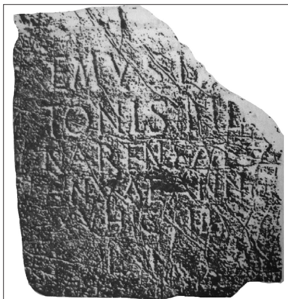
Sl. 1. Epigrafski nadgrobni cippus iz Gatačkog polja na kome se spominje etničko ime Naresa (Po: Atanacković-Salčić 1990, 9)

Pripadnici ove etničke skupine služili su i u vojnim legijama rimske vojske u Panoniji. Do-