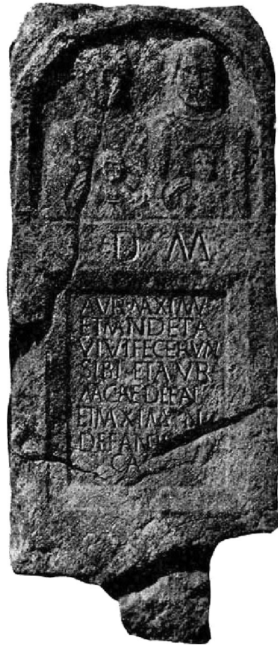
Sl. 3. Nadgrobna stela porodice Aurelijusa Maksimusa sa kombinovanom keltsko - ilirskom onomastikom pronađena u Homolju kod Konjica (Po: Patsch 1902, 313, Sl. 9)

Analizom epigrafske građe može se uočiti da se imena keltskog porijekla javljaju više kod žena nego kod muškaraca, te da se javljaju u porodicama koje imaju kobinovanu keltsko-ilirsku onomastiku. Lijep primjer te pojave izražen je na spomenutom spomeniku iz Homolja gdje majka ima ilirski cognomen Mandarta, a kći keltsko ime Magna. 60 Očigledno je keltski etnički element imao utjecaja na ilirske narode koji su naseljavali to područje. Naravno, ne može se reći da je u IV stoljeću pr. n. e. došlo do keltiziranja starosjedilaca. Prije bi se radilo o onomastičkom utjecaju malobrojnijeg elementa, u ovom slučaju keltskog, u brojniji ilirski. Onomastički ostaci mogu poslužiti kao dokaz tog procesa. Oni se zadržavaju dugo kod zajednica koje su na istom