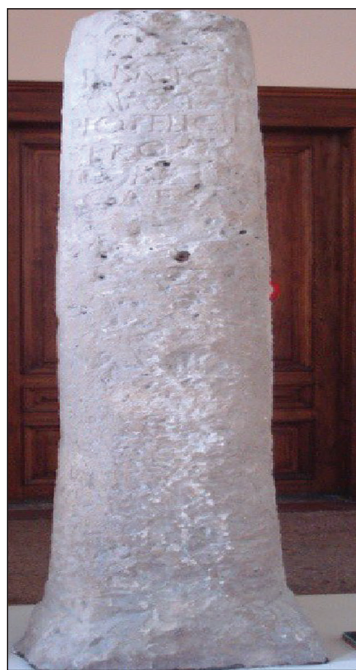
Sl. 7. Epigrafski miljokaza iz vremena cara Maksimina Tračanina (235 - 238), nađen u Podorašcu kod Konjica, trenutno se nalazi u Zemljskom muzeju u Sarajevu

organizovanja zahtijevao je postojanje određenog oblika urbane sredine u Konjicu i Lisičićima u IV stoljeću. Sadržaj teksta natpisa odražava veliku koncentraciju stranaca u tom dijelu Hercegovine. Prema njihovoj onomastici uočavamo da se najviše radi o italicima i heleniziranom stanovništvu Male Azije. Treba naglasiti da božanstva koja se pojavljuju na votivnim spomenicima nisu jedina božanstva koja su imala sljedbenike u istočnom dijelu Hercegovine. To se vidi na osnovu reljefnih predstava na nadgrobnim spomenicima.