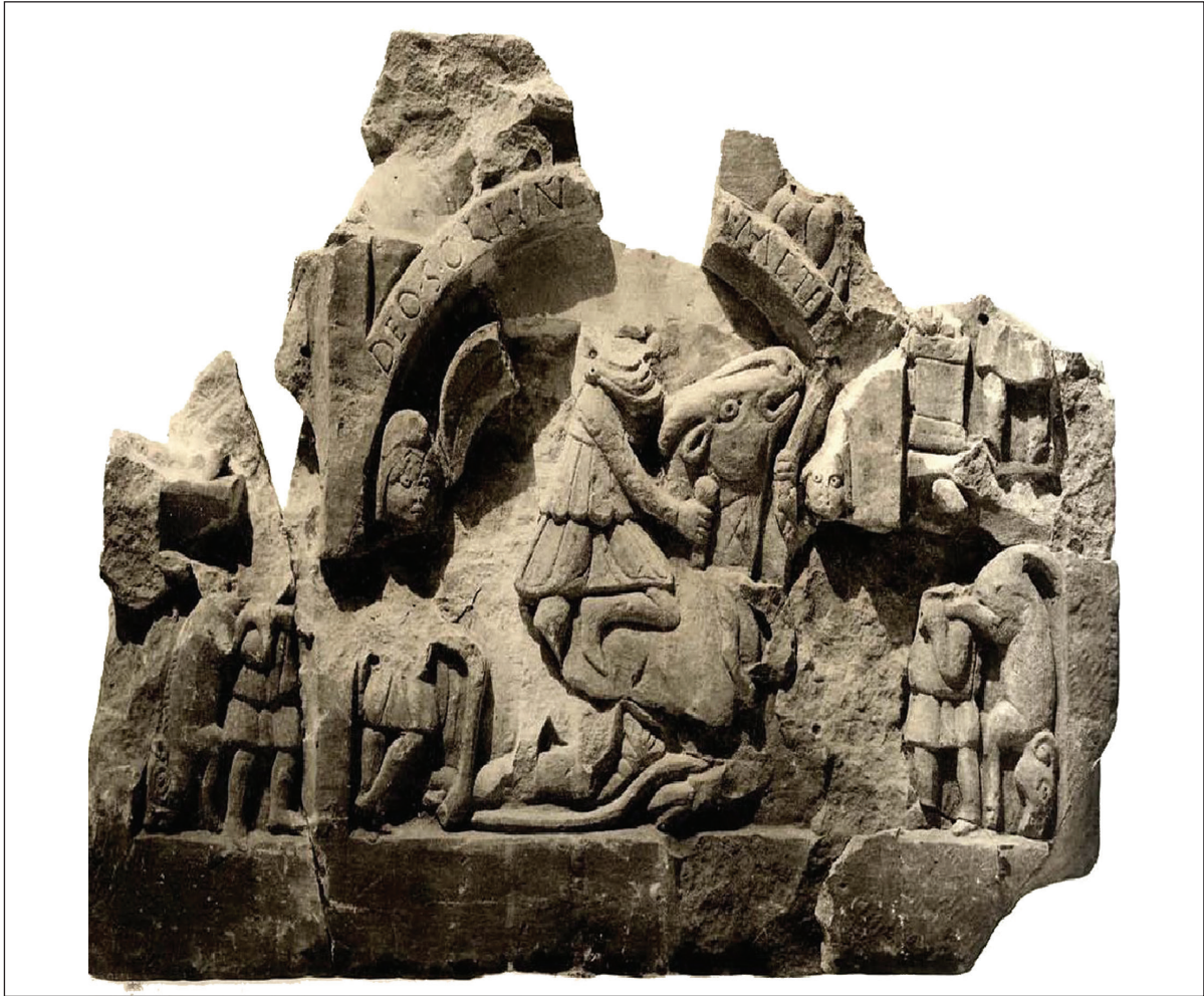
Sl. 8. Votivni spomenik posvećen istočnjačkom kultu boga Mitre. Nađen u Konjicu, danas se nalazi u Zemljskom muzeju u Sarajevu. Potječe iz IV stoljeća. Ime božanstva je napisano u specifičnom obliku Meteri.