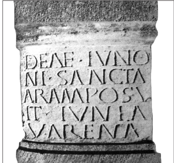
Sl. 6. Votovni spomenik posvećen boginji Junoni, pronaden u Potocima kod Mostara (Po: Imamović 1977, 365, Sl. 96)

lije Dolabela (14–20). 66 Materijalni dokaz za to je najstariji epigrafski miljokaz do sada otkriven u provinciji Dalmaciji koji je nađen u Podorašcu kod Konjica (CIL III 10164). 67 Ova cesta nije ucrtana u čuveni itinerarij Tabula Peutingeriana, ali je Ivo Bojanovski metodom rekognosciranja došao do podataka koji potvrđuju postojanje te ceste. Podaci vezani za putnu komunikaciju Narona – Argentaria mogu pomoći pri lociranju eventualnog municipalnog središta Naresa. Odgovoriti na pitanje kako je tekao proces prelaska peregrinske civitas u municipalnu jedinicu rimskog tipa kod Naresa jedan je od težih naučnih problema. 68 Nije pronađen niti jedan epigrafski