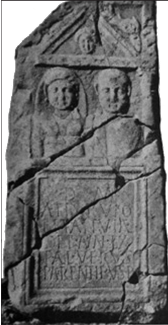
Sl. 4. Nadgrobna stela iz Ostrožca kod Jablanice. Stelu je Publije Elije Verus podigao svojim roditeljima Rufu i Tatui. Odjeća muške ličnosti na steli je keltska, a ženske ilirska (Po: Sergejevski 1965, Sl. 11)

stupnju razvoja, dok u slučaju akulturacije manje razvijene zajednice u više razvijenu, izvorna onomastika se brže gubi.