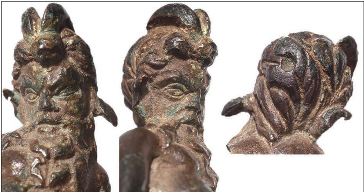
Sl. 2. Detalji lica antičke figurine iz Suhače.

delmatskog područja ima mnogo onih na kojima je to omiljeno pastirsko božanstvo u rimsko doba poprimilo Dionizove, odnosno Liberove karakteristike. Nebrida se na figurini ne može dokazati, a treba navesti da osim Dioniza i Heraklo ima nebridu. Heraklova obilježja uočena su na nekim Silvanovim reljefima na delmatskom području.