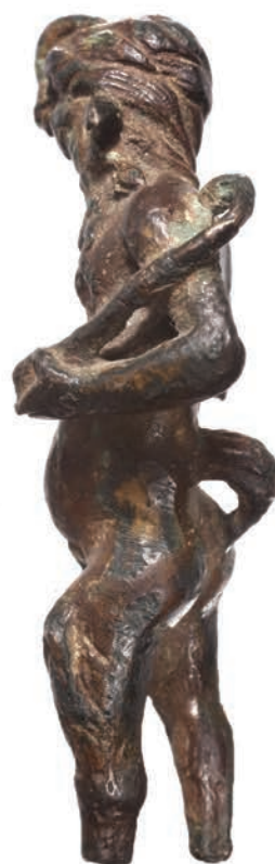
Sl. 1. Antička figurina iz Suhače.