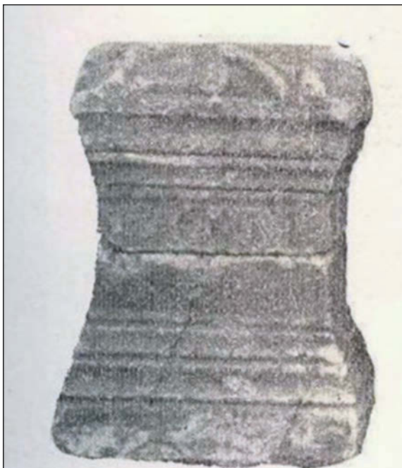
Sl. 1. Žrtvenik posvećen Jupiteru nađen u Peći (Pejë)

Od svih današnjih naseobina na Kosovu samo je suvremeno naselje u Peći (alb. Pejë) nastalo, razvijalo se, i još uvijek postoji, na temeljima antičkoga nalazišta u Pečkomu Polju, koji se nalazi na nalazištu zvanom "Gradina" na lijevoj obali rijeke Lumi i Bardhë (Ljumi i Bard).