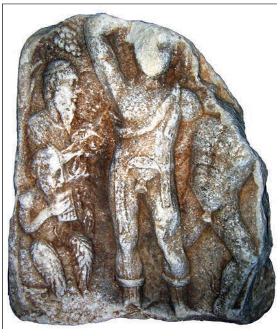
Sl. 5. Ploča sa prikazom Dionizova plesa nađena u sellu Vrellë (Vrelo) kraj Istoka

da je bio počeo i oživljavati pokojnike te ga je ra-srdeni Zeus ubio zato što je poremetio prirodnu ravnotežu rođenja i smrti. Prema mitologiji Aesculapios ili Asklepius nije bio sudionik dvanaest besmrtnih olimpskih bogova, budući da je na početku bio smrtni čovjek, koji je poslije diviniziran. Prema predaji, on je bio sin boga Apolona i svećenice ili nimfe Koronide. 23 U Rimskome Carstvu je štovani i pod imenom Asclepius ali i ka Aesculapius. 24