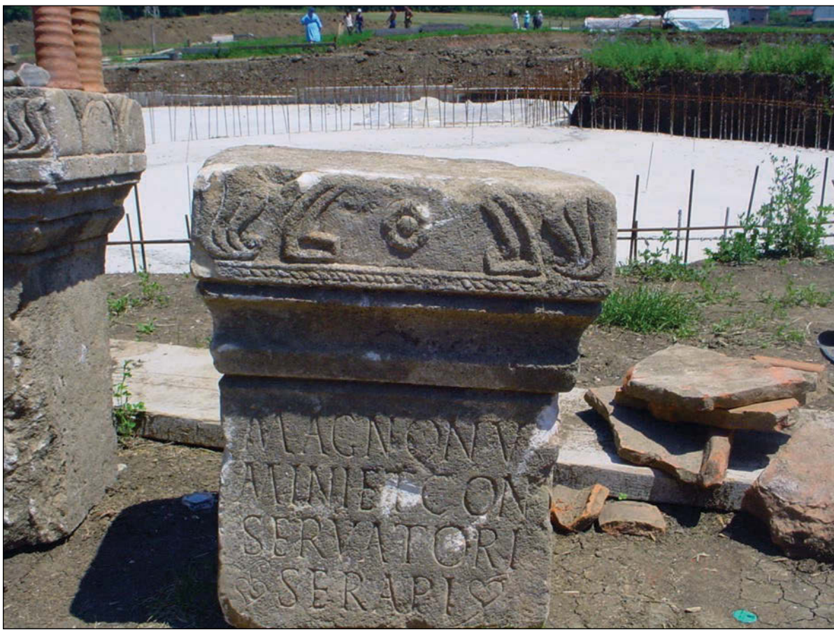
Sl. 7. Žrtvenik iz sela Zllakuqan (Zlakućan) kraj Kline posvećen Serapisu

postaviti da je u Scupiju moglo biti veće svetište štovanja Serapisa i drugih egipatskih bogova. 40 Najveći i najvažniji hram posvećen Serapisu, zvan Serapeion nalazio u Aleksandriji, u Egiptu, i kada je on razoren, koncem 4. stoljeća naše ere, prema naredbi cara Teodozija I (379.-395. naše ere), a na nagovor aleksandrijskoga patrijarha Theophilosa (oko 345.-412. naše ere), to je označilo i strogu zabranu i službeni kraj krivoboštva u Rimskom Carstvu. 41