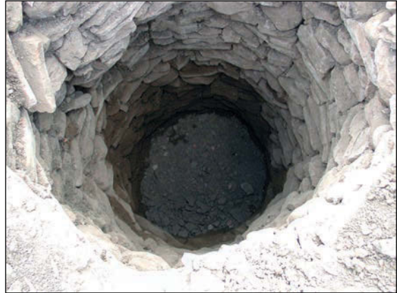
Sl. 12. Ostaci antičkog zdenca ozidanog kamenim pločama iz sela Zllakučan (Zlakučan) kraj Kline

sljedica da je s nastankomom kršćanstva, koje je na početku smatrano nastavkom i nasljednikom judaizma, 69 jedan dio Židova prihvatio Kristov nauk, držeći da je njegovo poslanje predstavljalo novi savez između Boga ( JHVH, Adonaj ) 70 i Židova, tim prije znajući da su Isus Krist kao i svi apostoli bili Židovi, 71 i to kada su i same kršćane proganjali Rimljani.