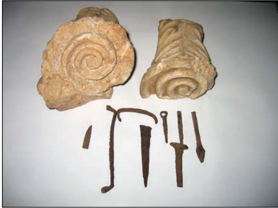
Sl. 11. Tragovi graditeljstva (hrama egipatskim božanstvima?) nađeni u selu Zllakučan (Zlakučan) kraj Kline