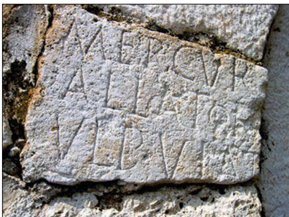
Sl. 3. Dio spomenika posvećenog Merкуру iz sela Staradran (Staradrane) kraj Istoka

Dva ovakva epigrafska spomenika, iz prvoga stoljeća naše ere, nađena su u gradu (IOM; IOM/EXV; Sl. 1) 13 , te po jedan u selima Pograxhë-Pograđe (IOM/T AEL CEL/SINVS/DECLP) 14 i Dresnik-Dresnik (IOM/T AEL C. . /SINVS/DECLP) 15 kraj Kline, koji potječu iz drugoga stoljeća naše ere, i vjerojatno im je zajednički dedikant (M. Aelius Celsinus), a još je jedan dosta oštećeni spomenik posvećen Jupiteru nađen u selu Veriq-Verić (IOM/. . . /; Sl. 2) 16 kraj Istoka.