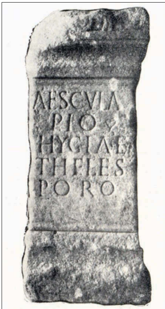
Sl. 4. Žrtvenik iz Peći posvećen Eskulapu, Higiji i Telesporu

skom i njenim pratiteljima. Ovdje se radi o štovanju bogova kao što su: Aesculap (Aesculapius), Higija i Telespor.