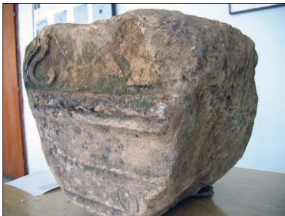
Sl. 2. Dio žrtvenika posvećenog Jupiteru nađen u selu Veriq (Verić) kraj Istoka

možda moglo raditi o Ptolomejevu (oko 100. – 170. g. n. e.) Siparuntumu ili Siparuntonu. 11