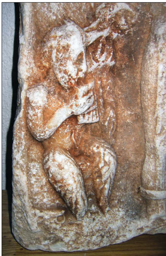
Sl. 6. Detalj ploče iz sela Vrellë (Vrelo) sa likom Pana koji svira u siringi prateći Dionizov ples

Smatra se da od Asklepija i Higije potječu asclepiadi pa i Hipokrat (460.-377. p. n. e.), za koga se vjeruje da je odvojio liječništvo od čarobnjaštva i praznovjerja pa se zato smatra utemelji-