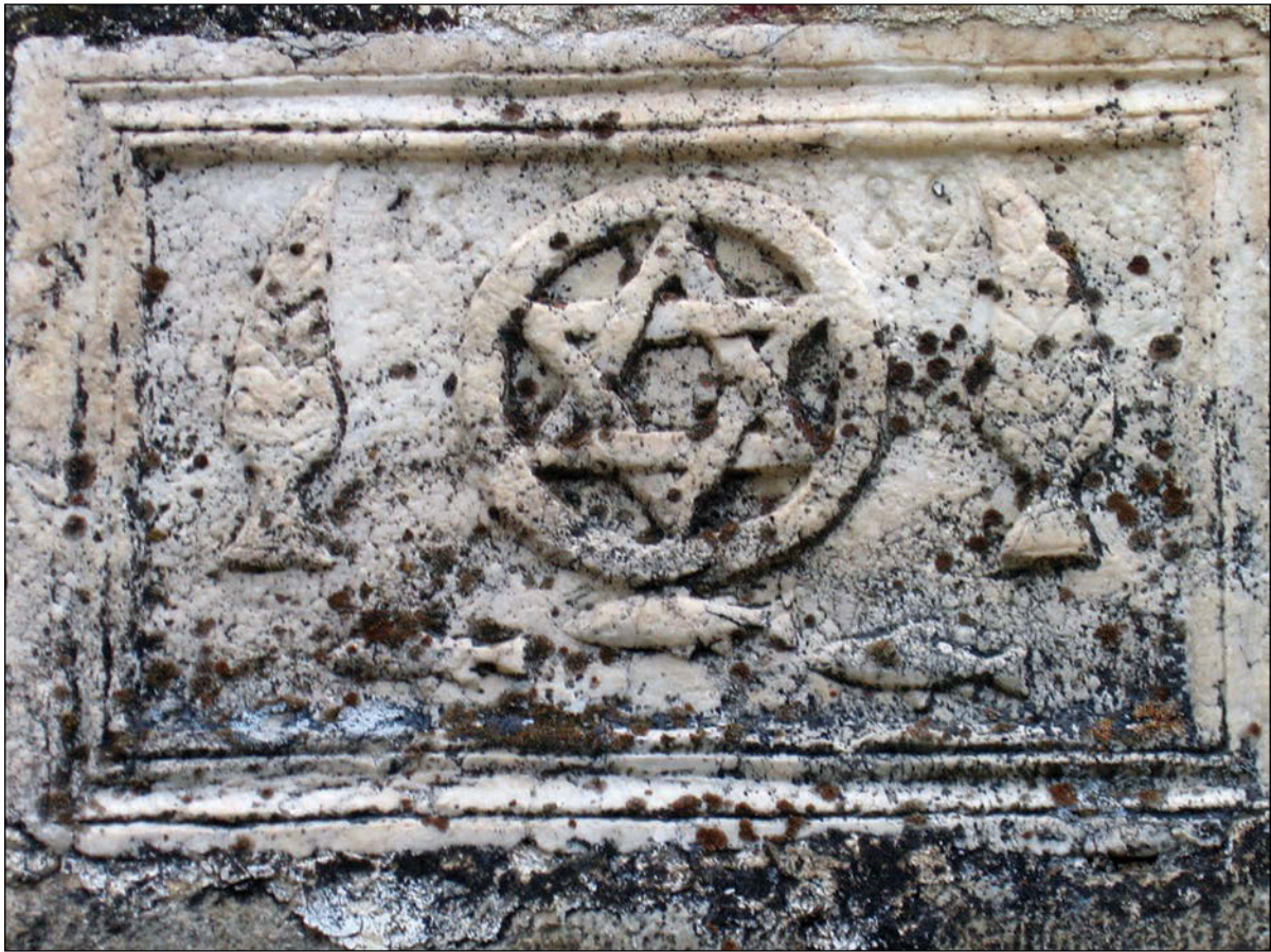
Sl. 9. Ploča sa judeo-kršćanskim značajkama uzidana u obrambeni zid Pečke Patrijaršije

bogova podzemlja, osobito sa štovanjem gospodara podzemnoga svijeta- Plutona ili Hada (grč. Διὸς, lat. Dis Pater). U antičkomu svijetu čempres je označavao besmrtnost i uskrsnuće, 51 a u ranom je kršćanstvu bio znak vječnoga života. Četinjače su smatrane simbolom smrti i žalosti, ali se u nekim istočnjačkim kulturama smatrane a i danas se smatraju i znakom dugoga života i postojanosti. 52