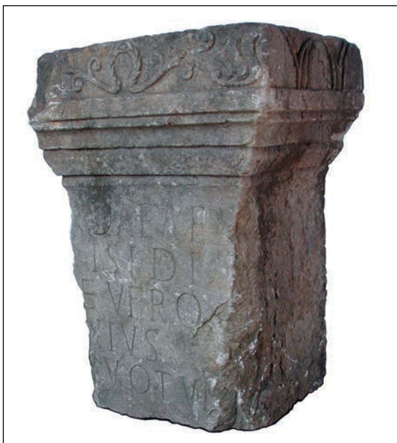
Sl. 8. Žrtvenik iz sela Zllakuqan (Zlakućan) kraj Kline posvećen božici Izidi

Horusom u njezinu naručju, bile uzor umjetnicima za oblikovanje prikaza Bogorodičina lika s malim Isusom. 47