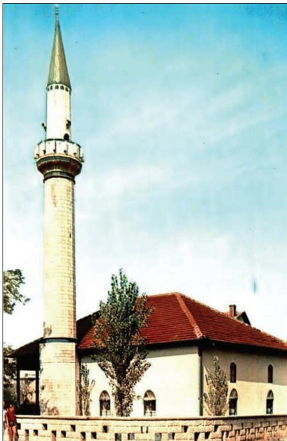
Slika 5. Izgled Sejmenske džamije početkom 70-ih

rezultat višemjesečnoga rada članova građevinskog i džematskoga odbora Sejmenske džamije da se, uklanjanjem unutarnje, a potom i vanjske fasade džamije da vizuelno zanimljiviji izgled objektu s ciljem prepoznavanja njezine arhitektonske i šire kulturnohistorijske vrijednosti za lokalnu zajednicu – Grad Zenicu i njezine stanovnike. No, trebalo je (u pravno-proceduralnom smislu) provesti nekoliko obaveznih koraka. Kao prvo, na osnovu iskazane potrebe džemata i medžlisa IZ Zenica kao investitora, trebalo je izvršiti prethodne radove istražnoga karaktera (temeljem Uredbe Vlade FBiH br. 36/08 iz juna 2008), uz dozvolu federalnog ministarstva prostornog uređenja. Prije otpočinjanja istražnih radova, pismenim su putem morali biti obaviješteni djelatnici gradske službe za urbanizam Grada Zenice. Tek nakon provedenih radova istražnoga karaktera koji, između ostaloga, podrazumijevaju čišćenje objekta, detaljno geodetsko snimanje, geotehnička i geomehanička ispitivanja tla i temelja objekta, analizu stabilnosti svih konstruktivnih elemenata s tehničkim izvještajem i predloženim mjerama sanacije