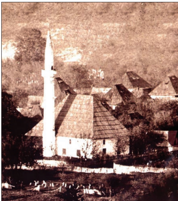
Slika 4. Izgled Sejmenske džamije s mezarjem do 1905.

vremena (kasni srednji vijek), što je dobro pokazano na primjeru obnove bijeljinske Atik džamije tokom 2003, kada su u temeljima džamije otkriveni srednjovjekovni nadgrobni spomenici – stećci s epigrafskim natpisima i sl. 24 Praksa korištenja spolija, bilo srednjovjekovnih bilo antičkih, primjetna je prilikom gradnje ili, češće, obnove vjerskih objekata svih konfesija na prostoru Bosne, posebno tokom turbulentnih razdoblja kakva su zasigurno bila u vrijeme Velikoga bečkog rata (1683–1699) ili vrijeme XVIII stoljeća (period intenzivnih ratnih sukoba s Mlečanima, a posebno Habsburgovcima – od 1714–1718, ljeta 1737. pa sve do 1791), kada je vladala velika oskudica u svemu pa i u građevinskome materijalu, te su domaći zidari, zarad obnove manastira, crkava ili džamija koristili sve dostupne, a kvalitetne građevinske materijale (posebno kamen). Prilikom ponovnog snimanja stanja u mezaristanu oko Sejmenske džamije, koje je tokom 2007. proveo ugledni sarajevski kaligraf Hazim Numanagić, konstatovalo je postojanje 13 nišana, od kojih su četiri najstarija datirana u 1780/81, 1782/82, 1849/50. i 1855/56. godinu. 25 Na kraju, treba reći da je slučajni nalaz