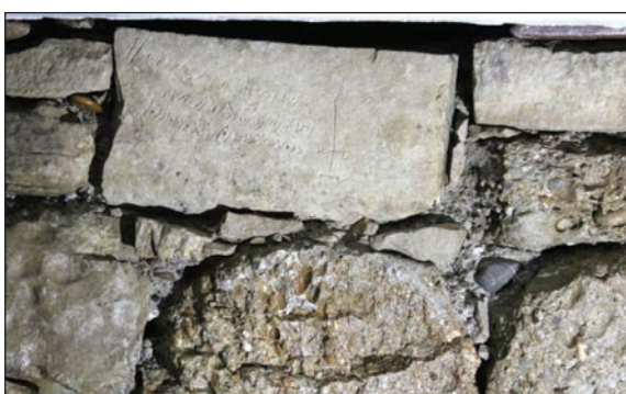
Slika 2. Originalni položaj kamena s natpisom u strukturi zida

1895. (pohranjena u Gazi Husrev-begovoj biblioteci u Sarajevu) sadrži više akata u kojima je naziv ove džamije isključivo Segban/Sekban džamija! 13 Jedan od tih dokumenata je i zahtjev (vjerojatno prvi poznati) za obnovu Segban džamije, koji je mutevelija džamije, tokom 1890., uputio Zemaljskom vakufskome povjerenstvu u Sarajevo, na osmanskom turskom i bosanskom jeziku. 14