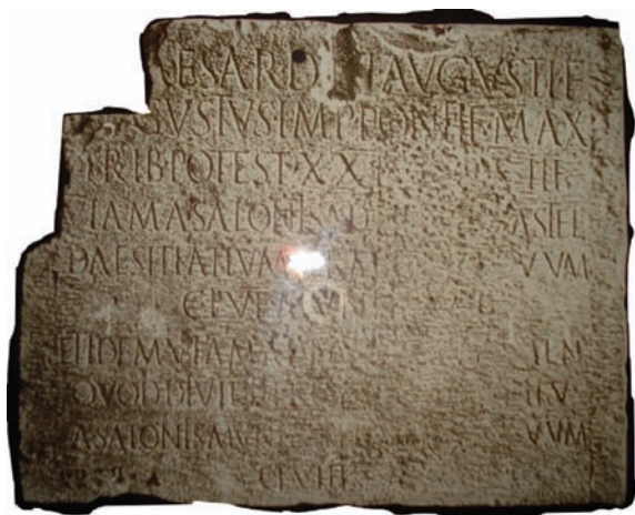
Sl. 1.

5. Prema dicianskoj planini Ulcira, dužine 77, 5 rimskih milja (113-116 km). 31