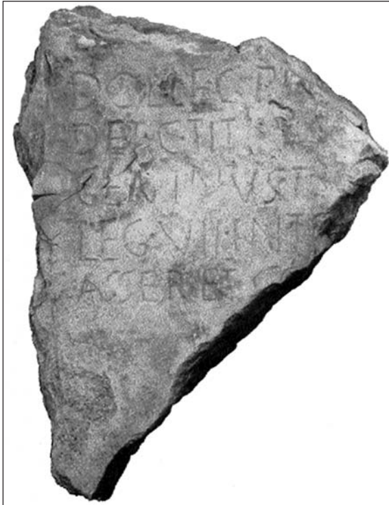
Sl. 7. (Preuzeto iz Čače 2003, 20.)

potrebi. Kada je bilo u pitanju pravo na određeni teritorij, domorodačke zajednice su se međusobno sukobljavale oko pašnjaka, plodnih zona, izvora soli, riječnih tokova, rudnika i sl. Ta kronična nestabilnost je sigurno kao posljedicu imala i činjenicu da se, izuzev kratkotrajnog iskustva za vrijeme Velikog ilirskog ustanka od 6. do 9. god. n. e., ilirski narodi na Zapadnom Balkanu nisu ujedinili. Samim time je jedan dio tih spornih situacija, najviše u vezi s teritorijalnim razgraničenjem i pitanjem međa, poticao još iz doba samostalnosti, a dio je nastao u toku prvog razdoblja rimske vladavine i u toku i nakon nove regulacije političkih, društvenih i teritorijalnih odnosa u obje provincije poslije ugušenja ustanka.