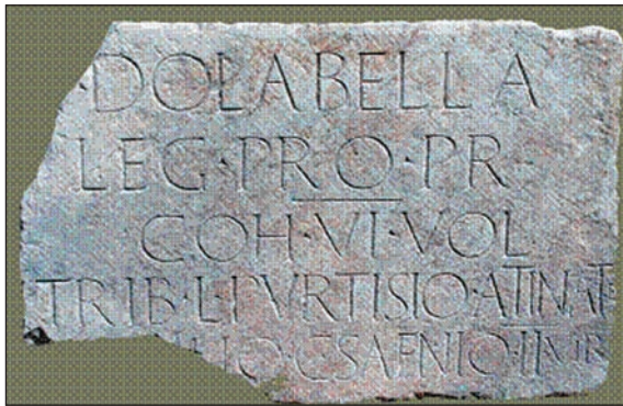
Sl. 4.