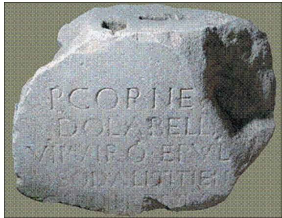
Sl. 5. (Preuzeto iz: Glavičić 2008 46, Sl. 1)

je na Zapadnom Balkanu. Preko njega bi se tako otkrili i službeni nazivi ilirskih provincija nakon podjele jedinstvene provincije Ilirik. Sudeći po tome što se Dolabela titulira kao legat i Augusta i Tiberija, njegov dolazak na namjesničku funkciju u Dalmaciju treba datirati prije 19. VIII 14. god. n. e., odnosno Augustove smrti. Ali sami nastanak epigrafskog spomenika treba datirati u vrijeme nakon Augustove smrti i njegove deifikacije (17. IX 14. god. n. e.). Uz to, na natpisu se navode i civitates Superioris / provinciae {H} Illyrici , te se pokazuje i na vrlo bitnu formaciju provincijskog uređenja – autonomne političke i teritorijalne jedinice peregrinskih naroda. Njihov broj na prostorima provincije za vrijeme Dolabeline uprave nije vjerovatno odstupao od liste peregrinskih civitates koju za ovu provinciju daje Plinije Stariji, a na osnovu vjerovatno nekog službenog popisa iz vremena cara Nerona (vl. 54-68. god. n. e.). 40 Posebno bi se ta nepromijenje-