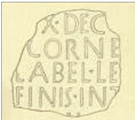
Sl. 8.

Ovdje je regulirana međa među zajednicama Bega i Ortoplina (možda japodske narodnosne