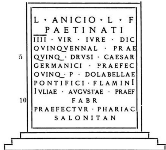
Sl. 3.

nalisu prefektu, kvinkenalisku Druzu Cezaru, Germaniku prefektu, kvinkenalisku Publiju Dolabeli, pontifiku flaminu, Juliji Augusti, prefektu kovača, prefektura Faria Salonitana.“