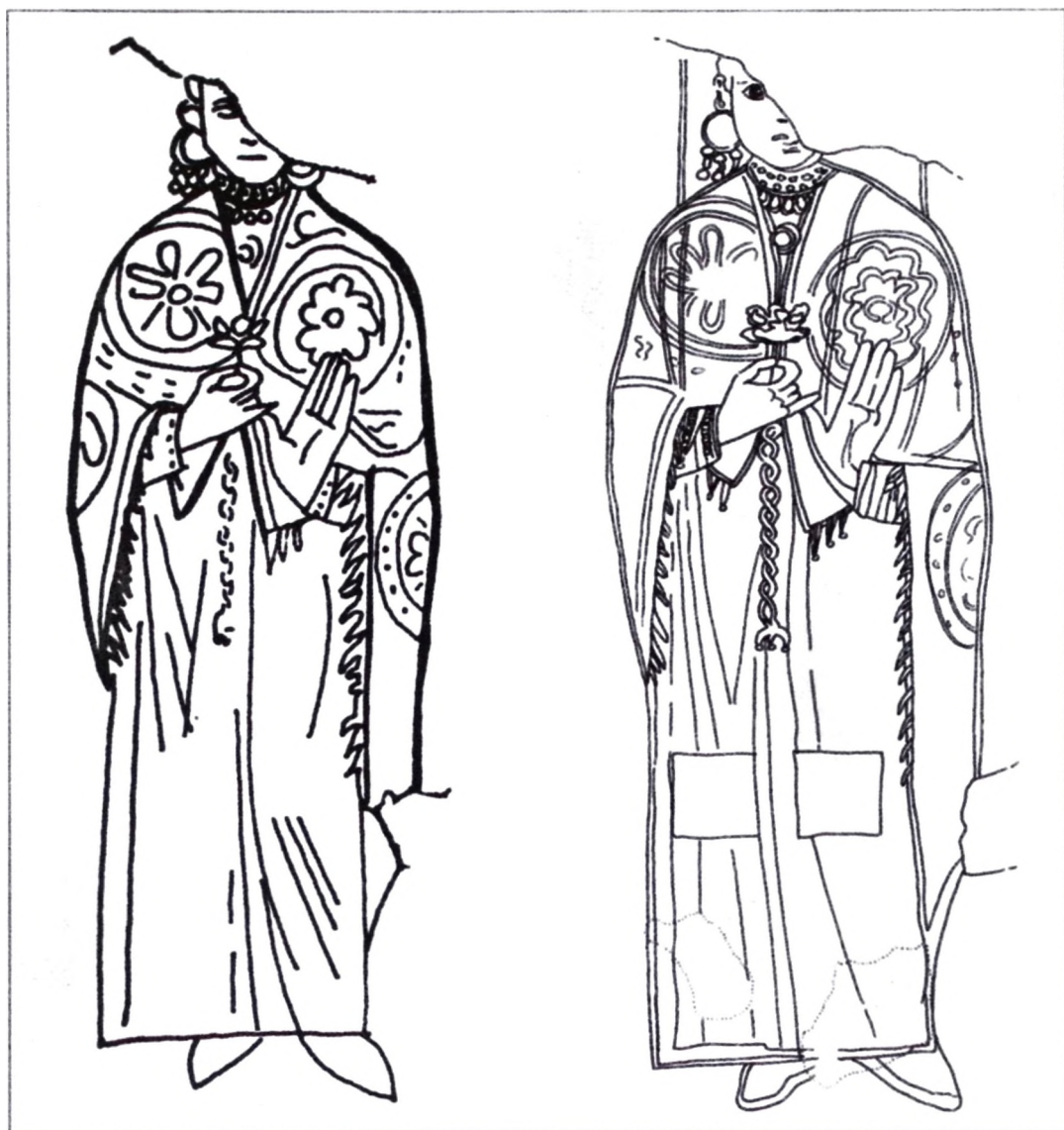
Sl. 3 Crtež ženske figure s ranobizantskim nakitom na freski u crkvi S. Maria Antiqua u Rimu: 1. prema: H. P. L'Orange – H. Torpp; 2. prema: F. Daim.

Kasnije je, osobito tijekom 7. i 8. stoljeća, dograđivana i višekratno oslikavana pa se, nakon sustavnih istraživanja pokazala kao prava riznica za proučavanje bizantskoga zidnoga slikarstva toga doba 41 . Nama zanimljiva freska je u kapeli Theodotus gdje je na jednoj od fresaka prikazana i porodica koja ju je donirala. Oslkana je tzv. helenističkim stilom bizantskoga slikarstva koji je tijekom druge polovine 8. stoljeća preplavio rimske sakralne gra-