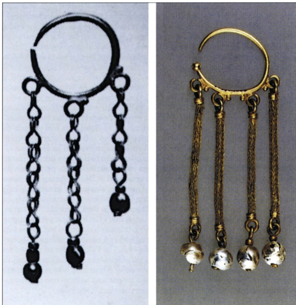
Sl. 10 Zlatne naušnice iz Egipta s obješenim lančićima koji završavaju biserima: a. 6. stoljeće (prema: I. Baldini Lippolis); b. 6.-7. stoljeće (prema: G. Zahlhaas).

Daima, protumačila kao tip Hohenberg 64 . Kako je na Bribiru također nađen samo jedan jezičac istoga tipa, razmišljajući načinom Petrinčeve, također bi bilo logično izvesti i zaključak o podudarnosti "načina nošenja takvih pojasnih jezičaca" u Rimu i na Bribiru u to doba. No, ona zna i za puno složeniju