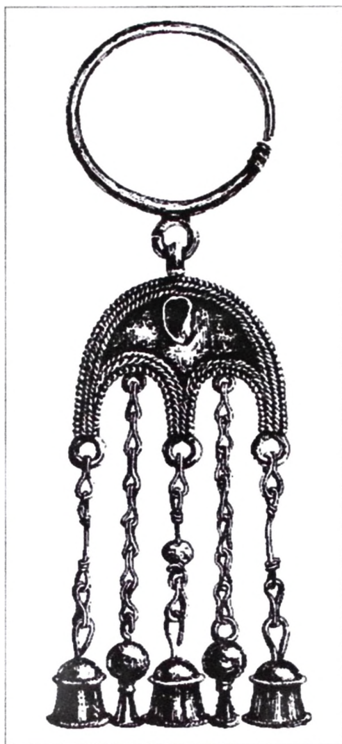
Sl. 6 Zlatna nušnica s trokrakim polumjesečastim privjeskom iz groba u mjestu Dolianova na Sardiniji, kraj 6. početak 7. stoljeća (prema: I. Baldini Lippolis).

lukružni privjesak prikazan shematski, a to upućuje na činjenicu da nije u potpunosti uvjerena u točnost svoga mišljenja, te da je u tome dijelu spremna na improvizaciju. To se, primjerice, nije dogodilo kada je na drugome liku s iste freske u okovu poasnoga jezičca, vrlo rasprostranjenog i čestog "U" tipa, prepoznala upravo tip Hohenberg, kao da je riječ o "kataloškom predlošku". Taj, dakle, nije shematski prikazan.