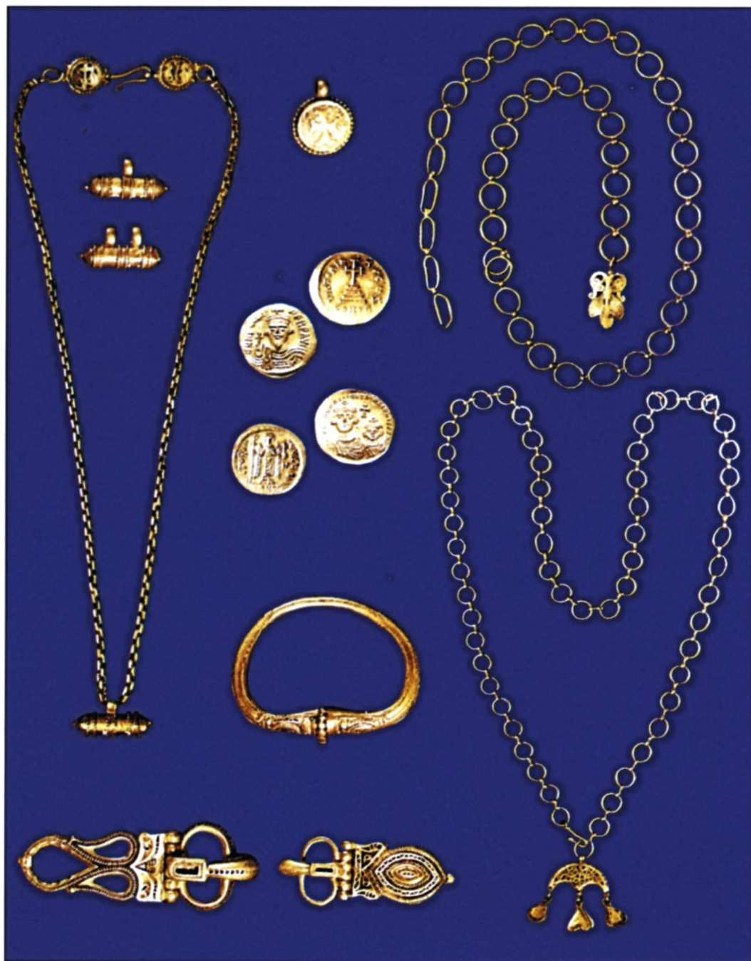
Sl. 5 Blago iz Mitilene na Lezbosu, prva polovica 7. stoljeća (prema I. Baldini Lippolis). Zlatni pojas s polumjesečastim trokrakim privjeskom (u donjem desnom uglu) potpuno je usporediv s onim koji je naslikan na freski u Rimu.