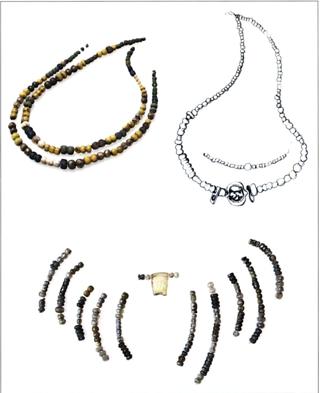
Sl. 1 Ogrlice s međusobno spojenim i pozlaćenim ili posrebrenim perlama i dodacima antičke provenijencije: 1. Konjsko u Dugopolju 2. Glavice kod Sinja, 3. Svećurje-Žestinj iznad Kaštel Novog.