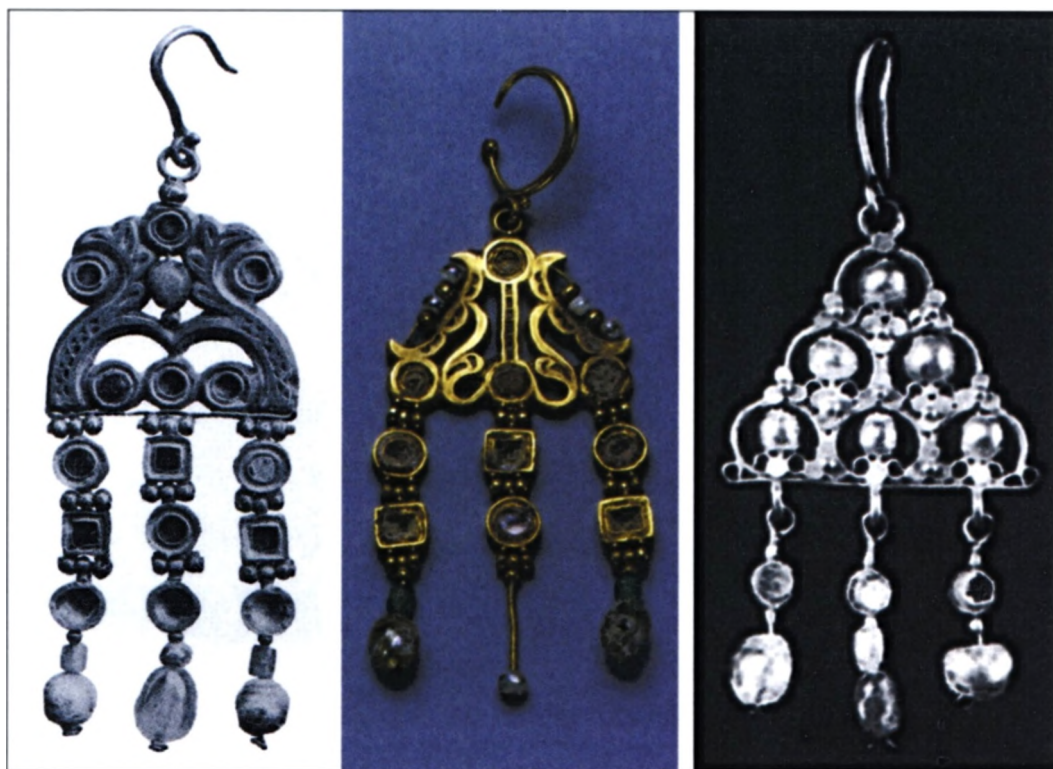
Sl. 7 Zlatne ranobizantske naušnice iz druge polovice 6. i 7. stoljeća: a. Cleveland Museum of Art – Cleveland; b. Freer Gallery of Art – Washington; c. British Museum – London (prema: Y. Stolz).