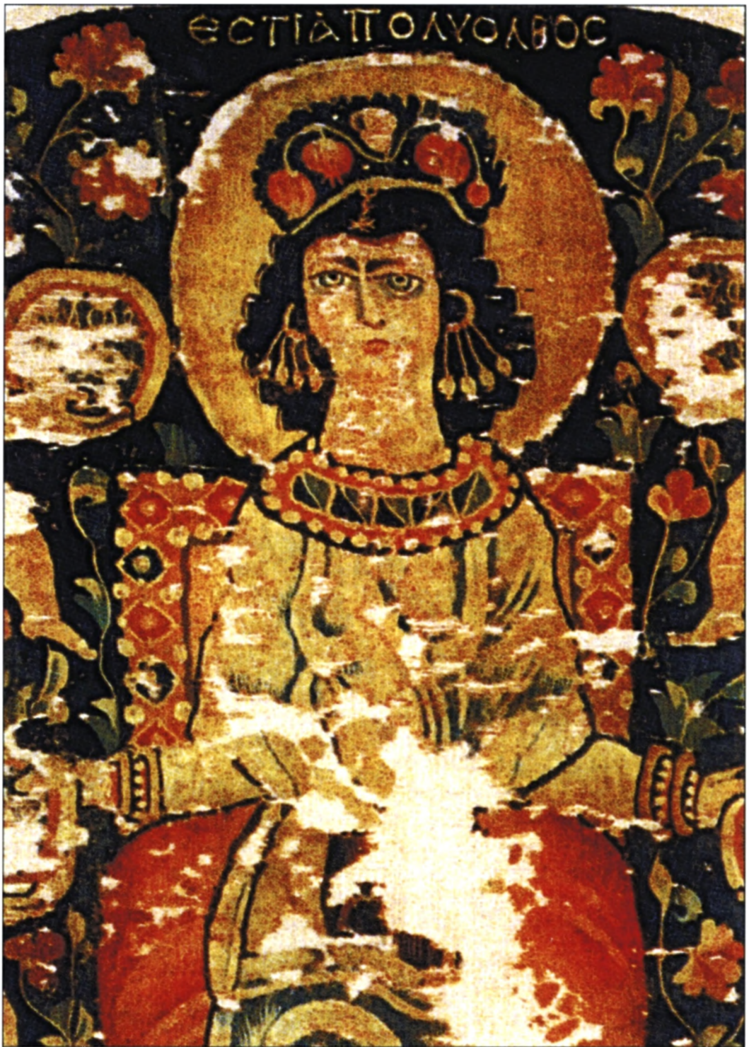
Sl. 4 Hestia Polyolbos na fragmentu vunenoga tekstila s naušnicama s obješenim lančićima koji završavaju biserima iz zbirke Dumbarton Oaks-a u Washingtonu, druga polovica 6. stoljeća (prema: Y. Stolz).