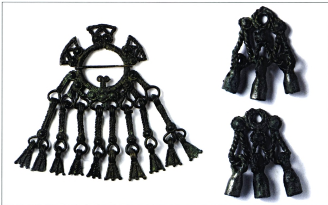
Sl. 9 Okrugla brončana spona i dva dodatka za odjeću s privjescima iz grobova 5. stoljeća u Rusiji (prema: Merowingerzeit 2007.).

U više puta citiranom tekstu Petrinčeve još je nekoliko dvojbenih opservacija. Tako npr. u činjenici da je na ženskoj osobi na freski iz Rima naslikan privjesak na pojasu i samo jedna naušnica na desnom uhu 62 Petrinčeva vidi podudarnost s arheološkim nalazom iz Velima gdje je u grobu isto tako nađena jedna slična naušnica i jedan sličan privjesak. Izvodi iz toga dalekosežan zaključak o podudarnosti "načina nošenja privjeska i naušnice" u Rimu i Velimu polovinom 8. stoljeća 63 .