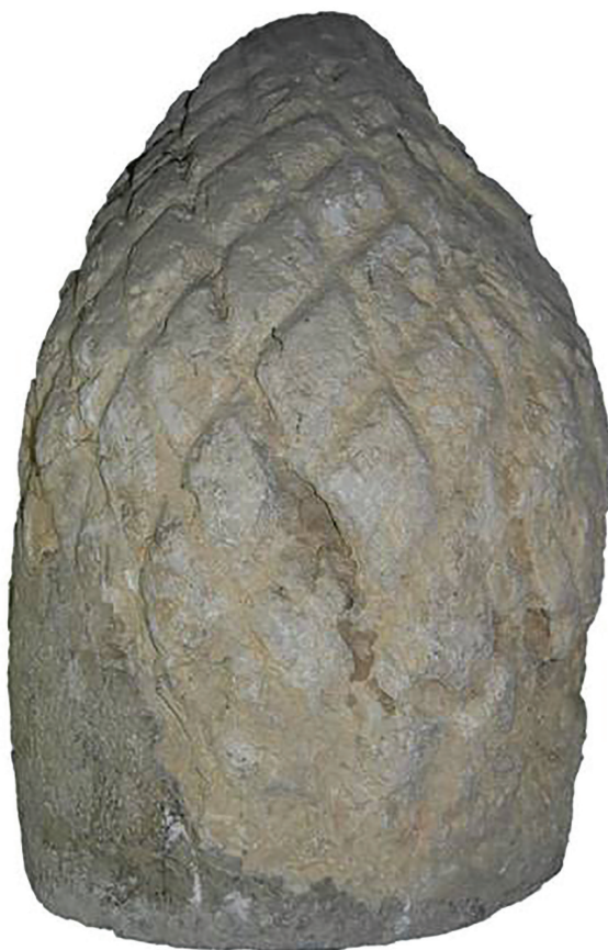
Sl. 2. Kamena šišarka (inv. br. 209)

šarke koje dozrijevaju tokom cijele godine. Zato su stari Grci i Rimljani smatrali ovaj plod simbolom plodnosti i razmnožavanja te vječne obnove životnih ciklusa. 20