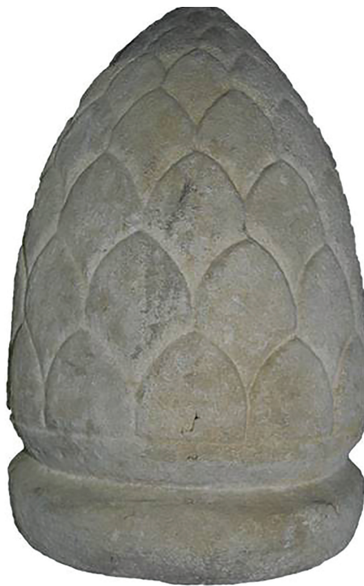
Sl. 1. Kamena šišarka (inv. br. 208)

i izgleda te da se osnovna razlika očituje u vrsti, odnosno boji kamena.