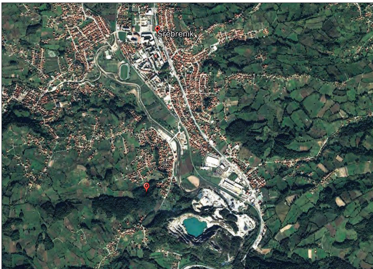
Sl. 1. Položaj ostave u naselju Rapatnica općine Srebrenik