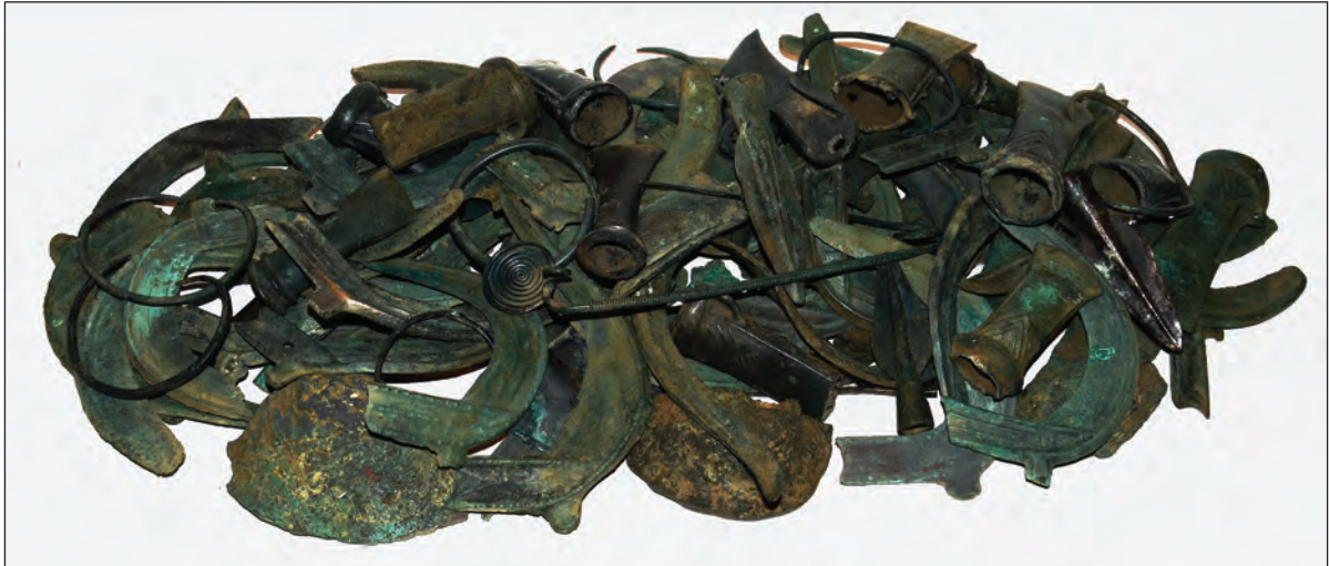
Sl. 3. Ostava iz Srebrenika

Srebrenik . 4 Prema riječima nalaznika 5 i obilaskom lokacije ustanovljeno je da su predmeti bili ukopani u jamu na padini brda s desne strane potoka (Sl. 1). Istraženi su u plitkoj jami na svega 20-30 cm ispod površine, izmiješani s humusom i sitnim kamenjem. Čini se vjerojatnim da je takva situacija rezultat ispiranja zemlje, pri čemu je prvobitni ukop morao biti znatno dublji. Nisu pronađeni dokazi o postojanju bilo kakve konstrukcije, a okolnosti nalaza ne dopuštaju egzaktnu interpretaciju načina deponiranja određenih nalaza u okviru jame. Ponovnim obilaskom terena provedena je detaljna prospekcija mikrolokacije; na istom mjestu suhim prosijavanjem zemlje i uz pomoć detektora (Sl. 2). Istraženo je dodatnih 26 predmeta, uglavnom manjih komada nakita i sirove bronce. Ukupan broj predmeta u ostavi iznosi sada 150 komada i najvjerojatnije predstavlja konačan broj predmeta pohranjenih u određenom trenutku (Sl. 3).