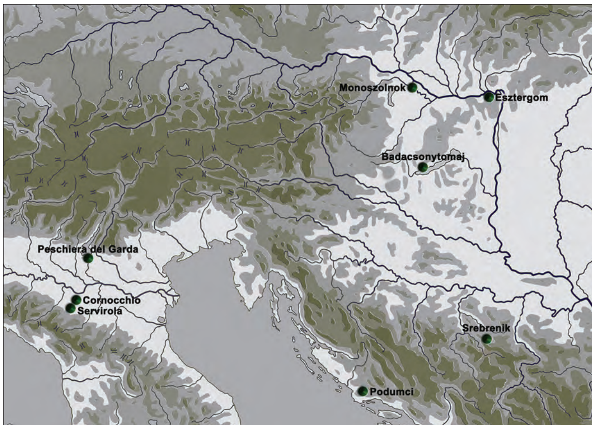
Sl. 6. Rasprostranjenost fibula u obliku violinskog gudala tipa Unter-Radl – Podumci (nadopunjeno prema Pabst 2014)

Ponajprije izdvajamo sjekiru s prema tjemenu podignutim zaliscima tipa Haidach, 10 karakterističnu za stariju fazu kulture polja sa žarama u sjevernijim ostavama alpske i južnapanonske regije (Sl. 5, 1). 11 Zatim, tu je mali ulomak ruko-hvatne ploče, visoko postavljenih ramena, s jednom zakovicom i sa sačuvanim utisnutim ukrasom spirale, usporednih linija i punciranih točkica (Sl. 5, 4). S obzirom na te elemente približavamo ga mačevima s punokovinskom drškom s tri rebra, ili tipu Erlach (Erding) ili tipu Schwaig, 12 koji će u oba primjera predstavljati do sada njihov najjužniji nalaz. Prvi je nalaz i ulomak noža jezičaste drške, koji uspoređujemo s noževima tipa Matrei – Mühlau (Sl. 5, 9). 13 U tipološkom