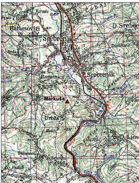
Sl. 2. Pozicija ostave u šumi Markuša u Rapatnici, Srebrenik (topografska karta, M. 1 : 50 000)

2016. godine (Sl. 1). Mjestom nalaženja, tj. mikrolokacijom, smješta se u šumu Markušu kroz koju prolazi potok koji se ulijeva u rijeku Tinju u Srebreniku (Sl. 1-2). Zemljopisno, to je područje doticaja ravničarskih dijelova južne Posavine s najsjevernijim planinskim lancem u ovom dijelu Bosne. Srebrenik je okružen masivima Majevice i Trebave koji se spuštaju u prostranu ravnicu. Njom, od juga prema sjeveru, protječe Tinja utječući sjevernije u rijeku Savu. No, dolina Tinje na svojevrsan je način i izolirana: s istočne strane planinskim vijencima Majevice, sa zapadne strane Ratišom, na sjeveru ju zatvara klisura Ormanica, a južno prijevoj Previla (Sl. 1-2). 3