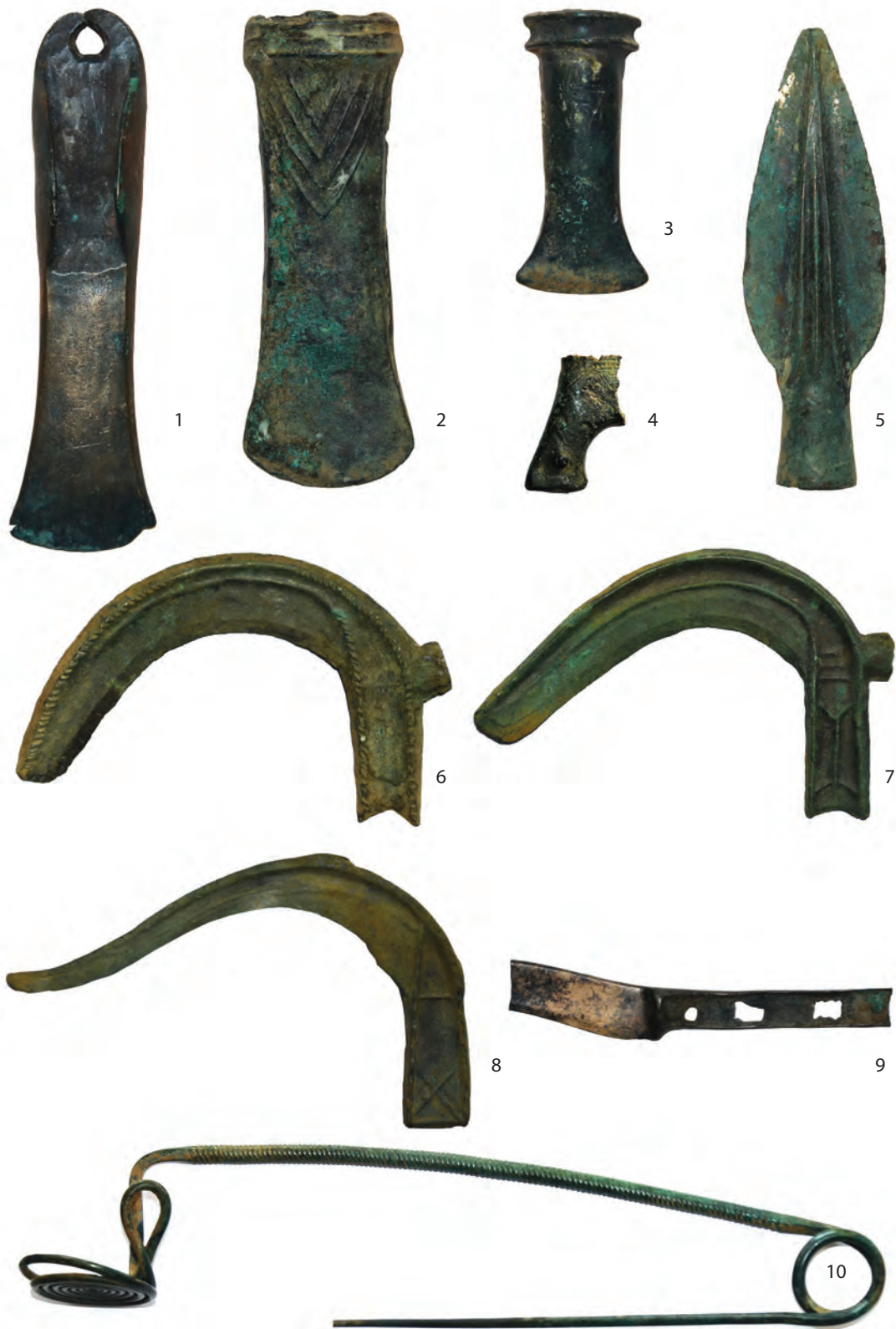
Sl. 5. Izbor predmeta iz srebreničke ostave