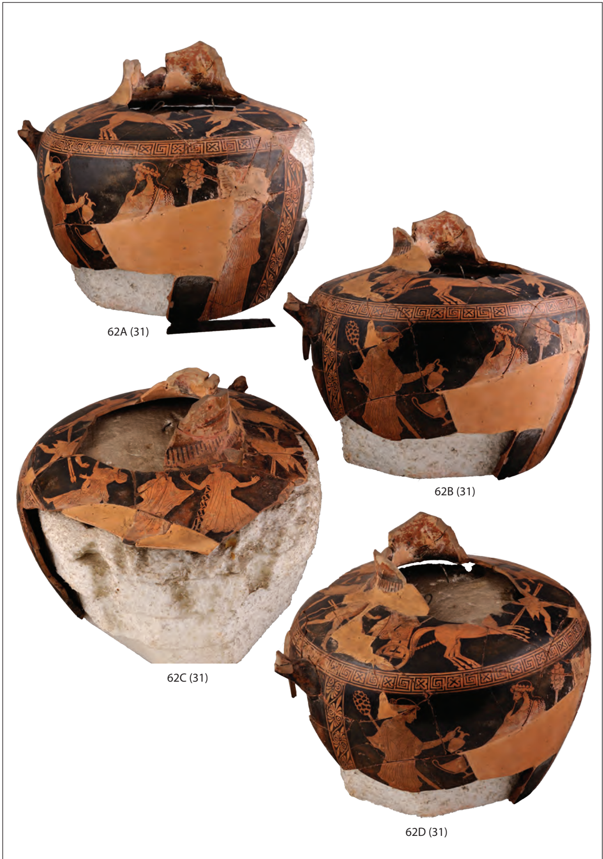
Tab. 23. Otmica djevojke