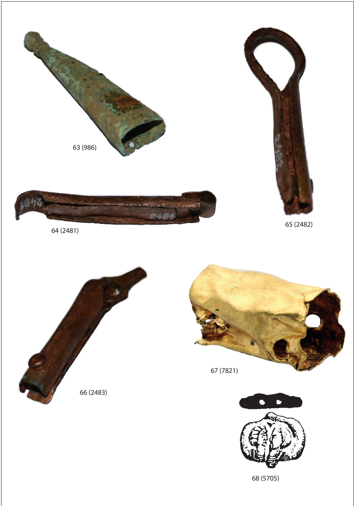
Tab. 24. Privjesak-Amulet-Bulla