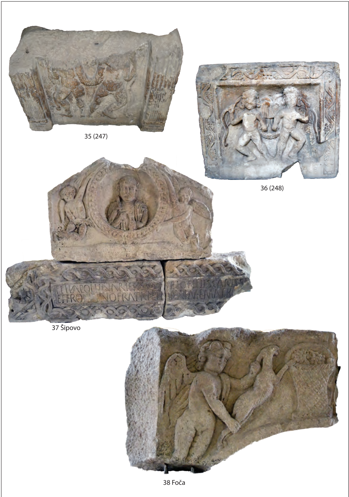
Tab. 11. Urne i arhitektonski dijelovi