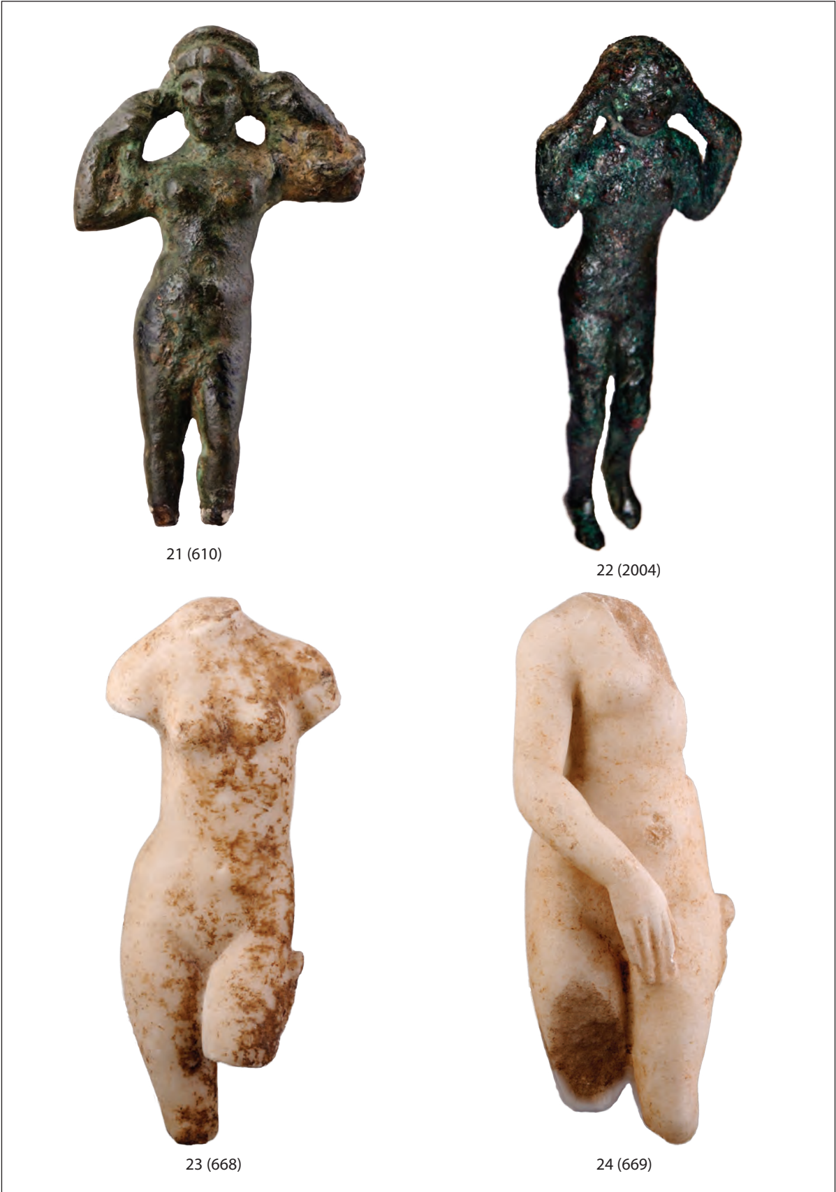
Tab. 7. Venera