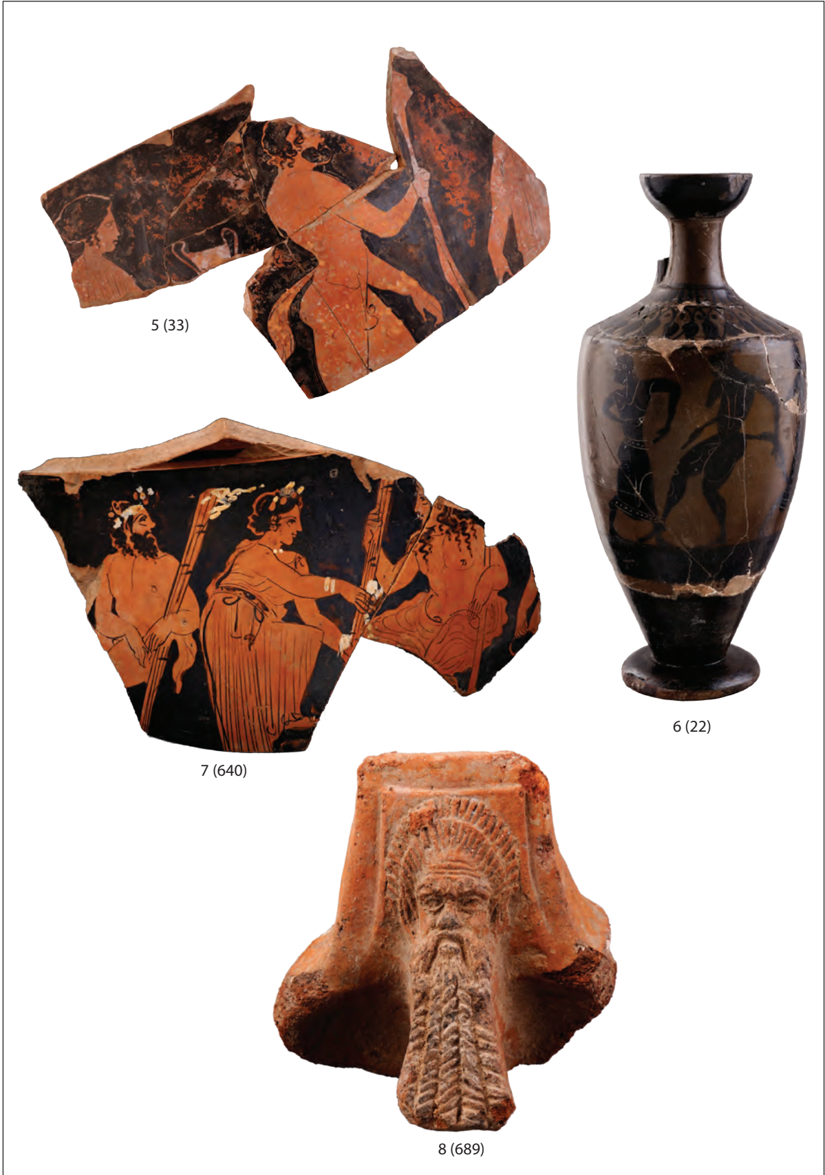
Tab. 3. Satir - Silen