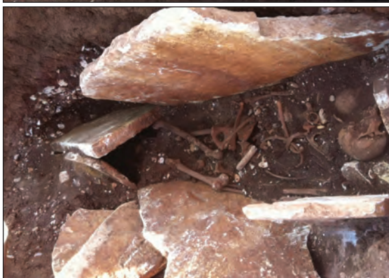
Sl. 9. Slike groba 2