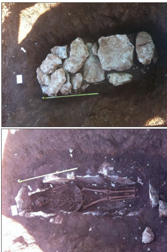
Sl. 17. Slike groba 9