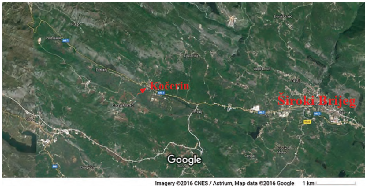
Sl. 1. Google map, Kočerin, 2016.