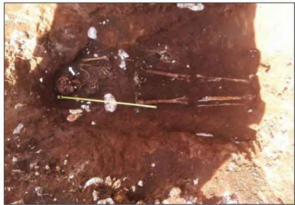
Sl. 16. Slika groba 17

Grob 17 nije imao kamene arhitekture, kostur je bio položen u zemlju na dubini od 23 cm. Orijentiran je SZ-JI. Kosti su bile u lošem stanju. Dužina kostura iznosi 134 cm, a širina karlice 31 cm. Pokojnik je bio u ispruženom položaju s lijevom rukom položenom uz tijelo, lubanje nagnute na desnu stranu, na ramenu kost. Nije pronađeno priloga niti nalaza.