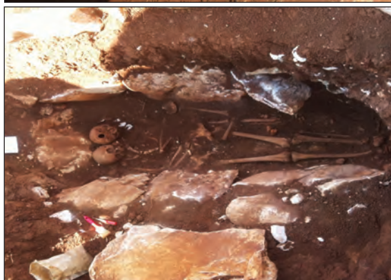
Sl. 10. Slike groba 1