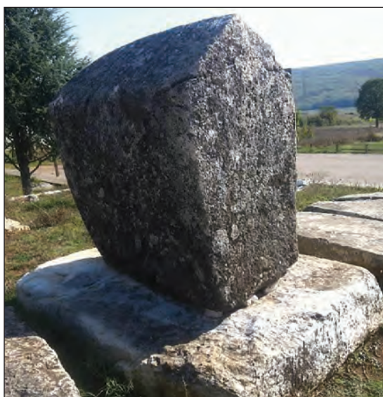
Sl. 8. Stećci 4 i 6

cijepljena na dva dijela, a s južne (175 x 73 cm) na pet dijelova. Dužina dna na koje je bio položen pokojnik bila je 165 cm. Sa sjeverne strane nalazilo se 20 cm zemlje, ostalo otkriveno. U grobu su se nalazili ostaci dviju odraslih osoba, do-