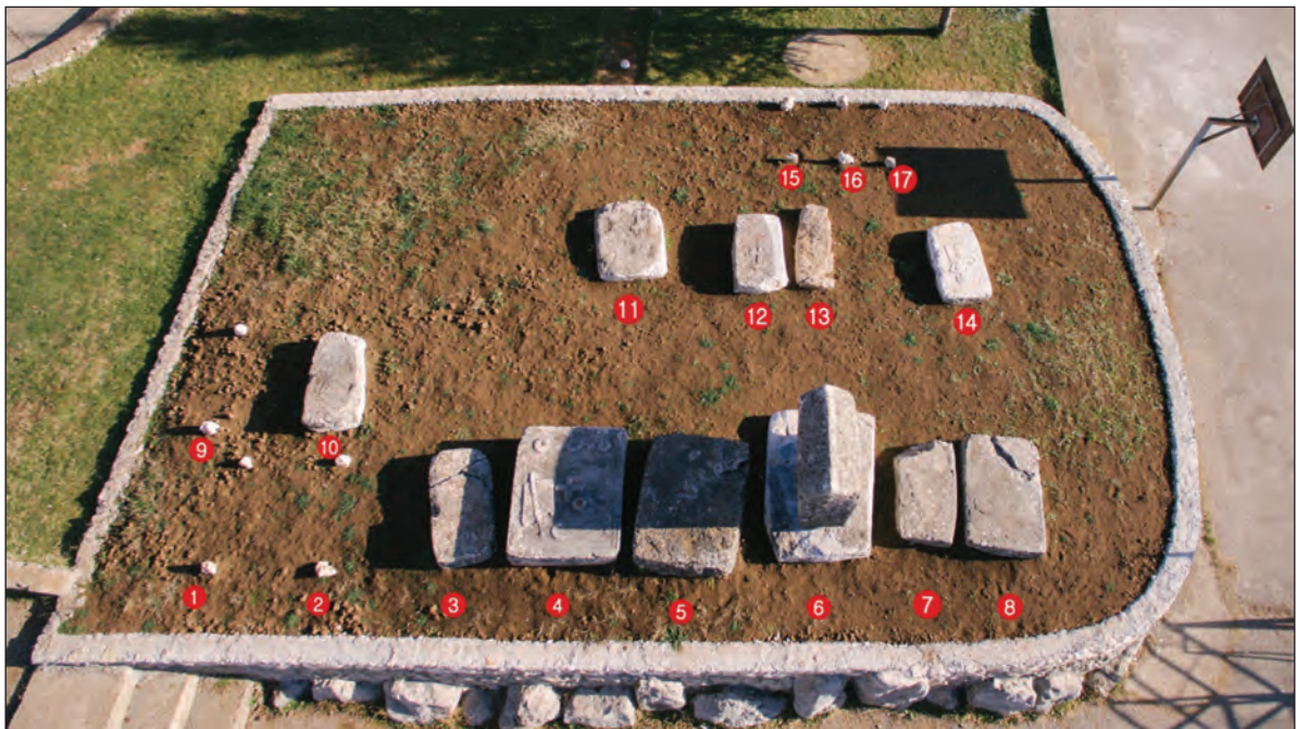
Sl. 5. Zračni snimak

ploča, dva velika sanduka i jedan sljemenjak. Postavljeni su u pravcu Z-I u nizovima. Za ovih 11 stećaka smatra se da su ostaci nekadašnje nekropole koja je, pretpostavlja se, brojila puno više primjeraka stećaka. Lokalitet je registriran u Arheološkom leksikonu III. 9