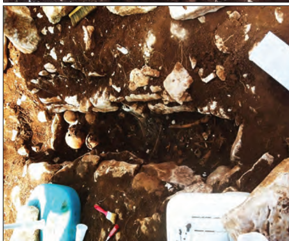
Sl. 12. Slike groba 14