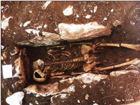
Sl. 15. Slike grobova 15 i 16