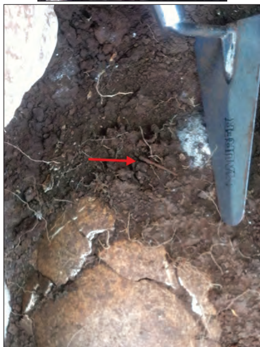
Sl. 11. Nalazi iz groba 14

Stećak u obliku sanduka, ima dimenzije 157 x 88 x 43 cm (grob 14). Ispod sanduka se nalazio kameni pokrov od 8 većih kamenih ploča i jedne manje. Dužina pokrovnog dijela iznosi 216 cm, dok je širina 79 cm. Na dubini od 35 cm nalazili su se koštani ostaci, ispreturani, a sa zapadne strane ostaci 4 lubanje (3 su dječije), s tim da je jedna od njih naknadno ukopana. Orijetiran je Z-I. Pronađena je željezna igla i željezni predmet tankog presjeka nepoznate namjene, kod lubanja. Okvir groba se sastojao od više manjih i većih ploča položenih u dva reda. Ispod jedne lubanje nalazila se jedna kamena ploča dimenzija 25 x 20 cm. Dimenzije unutrašnjeg okvira groba su 145 x 28 cm, a dubina na kojoj se nalaze kosti je 42 cm. Na stećku se nalazio figuralni prikaz i polumjesec. Radi se o ljudskoj figuri, moguće prikaz sveca zbog aureole oko glave.