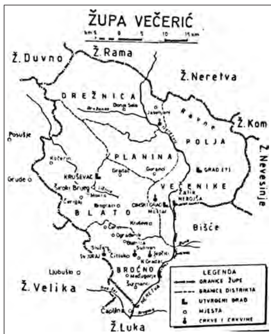
Sl. 2. Zemljovid župe Večerić (Sivrić 2004)

Na Kočerinu, na lokalitetu Lipovci, pronađen je nadgrobnni spomenik Vignja Miloševića ili Kočerinska ploča koji datira iz 1404. godine. Važnost Kočerinske ploče je i u tome što Viganj ističe bosanske vladare od bana Stjepana do kralja Ostoje. Na Kočerinskoj ploči nalazimo i prvi spomen Kočerina, gdje ističe kako pokojnik leži