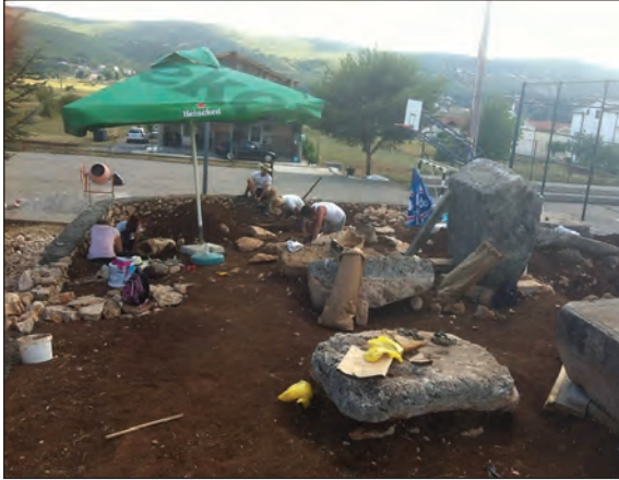
Sl. 3. Nekropola za vrijeme istraživanja, ljeto 2015.