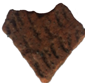
Sl. 7. Ulomak keramike pronađene u grobu 4

Grob 2 je u obliku dvoslivnog krova, s devastiranim bočnim kamenim pločama. Vjerojatno se nekad prije na ovom grobu nalazio stećak, imajući u vidu da su, kako je prije navedeno, ovo zapravo ostaci nekadašnje veće nekropole. Ploča je sa sjeverne strane (dimenzije 167 x 99 cm) ras-