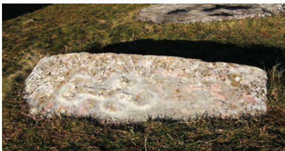
Sl. 14. Ploča s prikazom oranta prema Wenzel 12