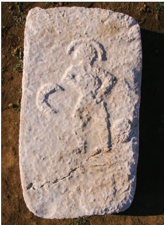
Sl. 13. Stećak iznad groba 14