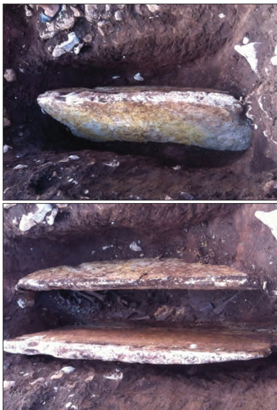
Sl. 6. Slika groba 4

je okrenuta na južnu stranu, a donja vilica se odvojila. Okomito iznad lubanje nalazila se manja ploča. Ovdje su pronađene kosti dvije individue.