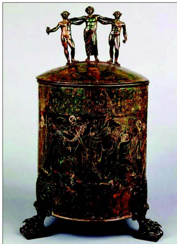
Sl. 3. Ficeroni cista iz Palestrine

Također bi se mogla uočiti izvjesna veza između ova dva mita, odnosno fragmenti jednoga u drugom, što bi predstavljalo direktnu potvrdu očuvanja suštinske podloge legendi i mitova te njenog prenošenja s generacije na generaciju. Tako se Kadmejski put poistovjećuje s rimskom Via Egnatiom , kojom je išao i raniji čilibarski put , a Jasonovo zlatno runo direktno se povezuje s čilibarom i njegovim prenošenjem na Balkan. Drepani i Feačani koji žive tu u Argonautici su okarakterisani kao susjedi Enhelejaca, dok je Kadmova ishodišna tačka na sjeveru, gdje je došao u