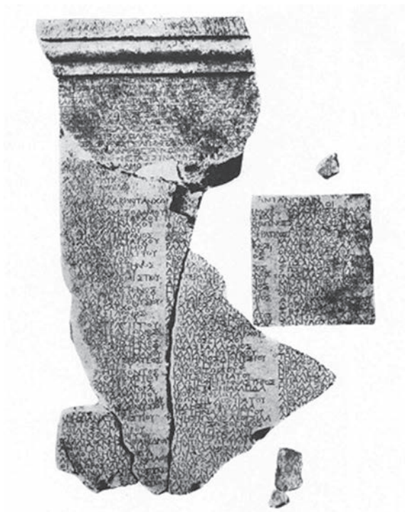
Sl. 6. Lumbardska psefizma (Po: Rendić-Miočević 1971)

se slažu brojni autori, 104 dok se numizmatičari pozivaju na mitsku ličnost Jonija, čija je legenda – IONIO – ostala zapisana na Issejskom novcu, 105 a koji se spominje i na grčkom natpisu pronađenom na Issi, na kojem se naziva Jonijevim otokom . 106 Tako se još jednom legenda isprepliće sa stvarnim događajima i antičkim spisima te ih dijelom i potvrđuje. S obzirom na brojna pisanja, kao i arheološke ostatke koji su vidljivi i neosporni, 107 jedini podatak koji nedostaje o Issi jeste tačno vrijeme osnivanja ove kolonije. Autonomno kovanje novca započelo je u IV st. pr. n. e., dok postoji nekoliko novčića iz ranijeg perioda, tačnije V st. pr. n. e. 108 Pseudo Skilak, koji je pisao u IV st. pr. n. e., navodi da je Issa grčki grad, 109 dok Pseudo Skimno u II st. pr. n. e. tvrdi da je to