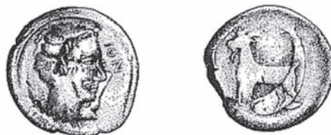
Sl. 7. Novac s IONIO emisijom (Po: Rendić-Miočević 1989)

sirakuška apoikija. 110 Što se tiče arheoloških ostataka, pronađeno je mnoštvo grčkog materijala, od kojeg neki potječe čak s kraja VI st. pr. n. e. 111 U vrijeme najvećeg uspona u III st. pr. n. e. Issa osniva naseobine 112 u Lumbardi na otoku Korčuli, 113 u Trogiru, 114 Stobreču 115 i Solinu. 116