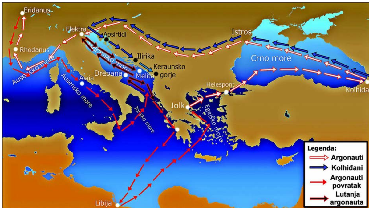
Sl. 2. Karta putovanja Jasona i Argonauta

se s pravom mogu tako nazvati, ne zadržavaju na ovim prostorima, ne osnivaju svoje kolonije te s obzirom na to da su tu u prolazu, odnosno da teže povratku kući. Razlog tome može biti i prevlast Istoka, koji u to vrijeme osniva svoje kolonije, što je također vidljivo u ovdje iznesenoj legendi o Kadmu. Strukturalni pristup mitu svakako je, bez obzira na konzistentne nejasnoće i nesuglasice, korelacijom svojih gross constituent units potvrdio kontakte Grčke i Jadrana, sačuvane u mitovima i legendama, a koje zavijene velom mitoloških likova, pojmova i pojava ostaju u pozadini cjelokupne priče, te tek njihovim izdvajanjem kao zasebnih jedinica mita postaju relevantni izvori i dokazi kolonizacije u širem smislu, odnosno njene predfaze.