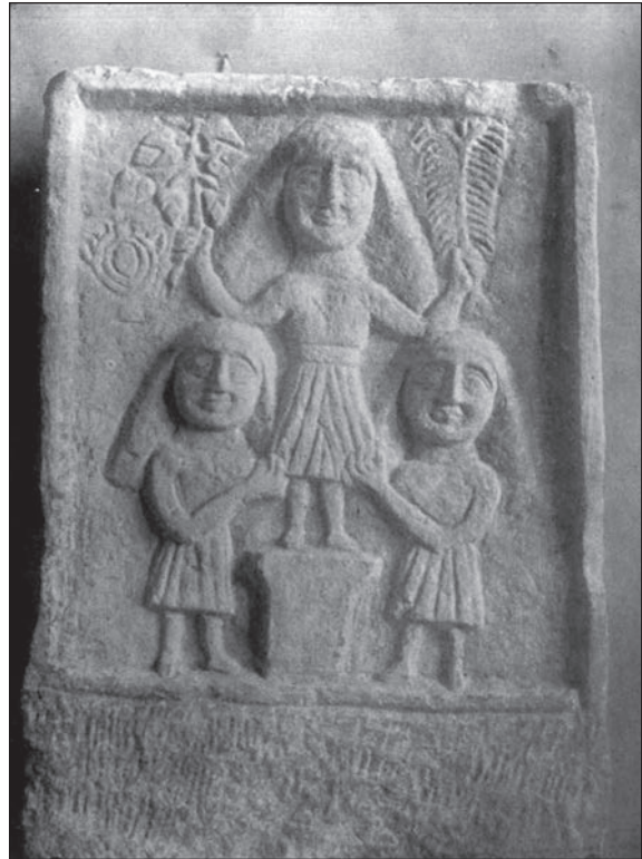
Sl. 7. Reljef Dijane i adorantica iz Opačiča kod Glamoča; Dijana u sredini na postolju i drži grančice u rukama (Po: D. Sergejevski 1929, 103, Tab. X)

nije bilo Silvana, boginju bi bilo nemoguće identificirati kao Dijanu. Oba reljefa su vjerovatno rad istog majstora. Dijana ne samo da nije nikad prikazivana s grančicama nego je i njena kulturna zajednica s nimfama neuobičajena. Dijana je bila ilirsko, autohtono božanstvo koje se uz Silvana najviše poštovalo u Bosni i Hercegovini u antičko doba. Bila je prikazivana kao boginja lova, poistovjećena s Artemidom. Dakle, u kakvoj bi vezi mogla biti Dijana i boginja s kulta dunavskog konjanika? Odgovor možda upravo leži u prikazu grančica koji se ne pojavljuje ni kao standardan motiv u predstavama boginje Dijane ni u predstavama s prikazom kulta dunavskih konjanika. U vrijeme kada je Rim politički objedinio narode koje je osvojio, došlo je do korjenitih društveno-političkih procesa, prilikom kojih je došlo i do rekonstruiranja njihovih religija, i to na način da su pojedini narodi svoje kultove i svoja božanstva ili religiozna shvatanja pokušali dovesti u vezu s rimskim, tj. došlo je do interpretatio Romana . 24 Uprkos korjenitim promjenama koje su se odigrale nakon uspostavljanja rimske vlasti na