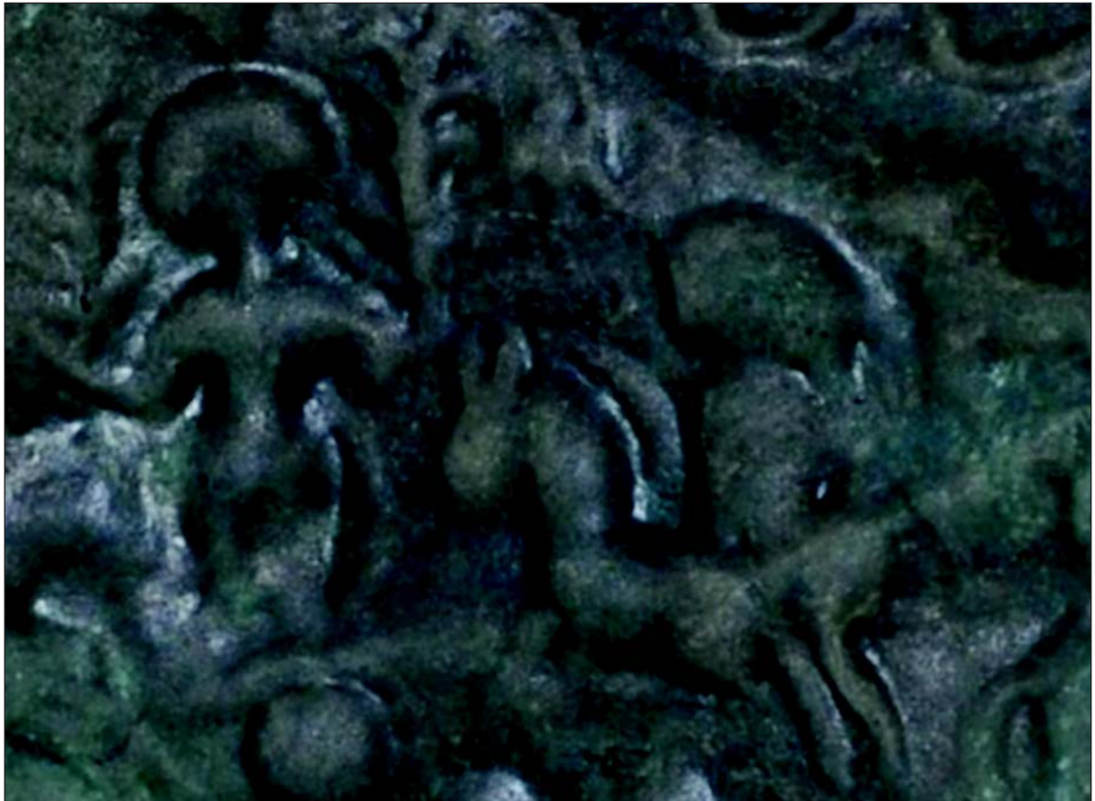
Sl. 2. Detalj sa pločice iz Đelilovca, na prikazu boginja koja u rukama drži dvije grančice, desno konjanik