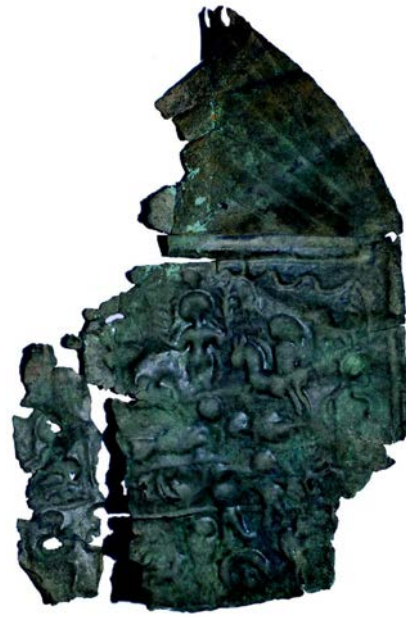
Sl. 5. Pločica dunavskog konjanika

zmija, konj, riba pa čak i bik. Neki elementi ovog kulta su vjerovatno imali uzor u mitraizmu koji je bio široko rasprostranjen u Rimskom carstvu i na prostorima današnje Bosne i Hercegovine. 19