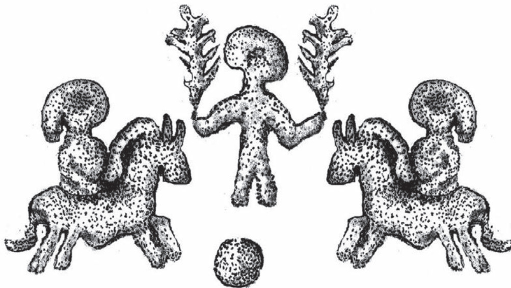
Sl. 3. Detalj sa pločice iz Đelilovca, na prikazu boginja okružena sa dva konjanika (Crtež: S. Maslić)