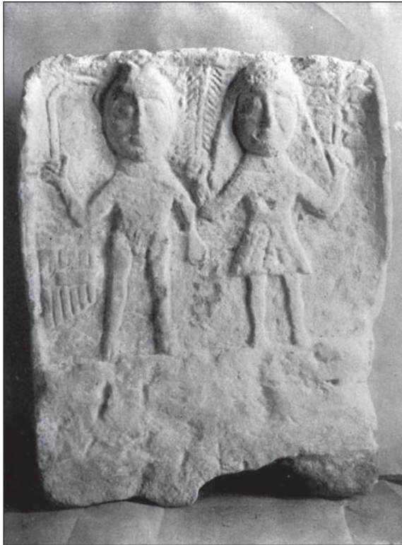
Sl. 6. Reljef Dijane i Silvana iz Opačiča kod Glamoča na kojem Dijana drži grančice u svojim rukama (Po: D. Sergejevski 1929, 102, Tab. IX)