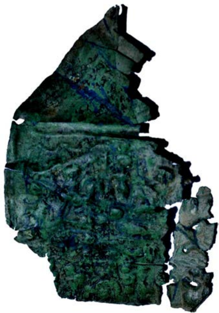
Sl. 4. Pločica dunavskog konjanika iz Đelilovca